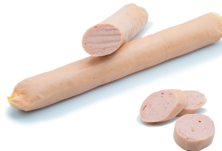
IMMAGINE PRODOTTO (da catalogo a titolo esemplificativo) Product image as example

Non forare la confezione. Aprire la confezione 10 minuti prima di affettare. Do not pierce the package. Open the pack 10 minutes before slicing.